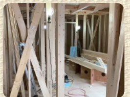
筋交いや耐震金具などで強度UP