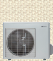
ノーリツ ハイブリッド給湯システム