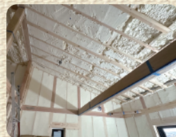
気密性の高い吹付け断熱を採用