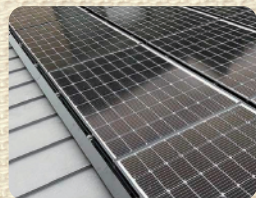
長州産業 太陽光パネル