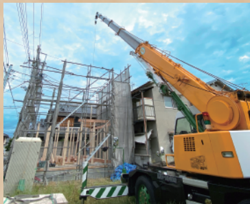
大工さんたちの絶妙なチームワークで家の枠組みが完成します。

家を建てる時に必ず行うのが「棟上げ(むねあげ)」です。棟上げとは基礎と土台が仕上がった後に行われるもので、家の骨組みを組み上げる工程のことを言います。この日は重機を使って材料を運び込み、大工さん達が協力して柱や梁、屋根部分の木材などそれぞれの部材を所定の場所に納めていきます。通常は屋根に野地板(のじいた)と呼ばれる下地材を貼るところまで作業が行われます。大工さん達が丁寧に手際よく家の骨組みを一日で一気に仕上げていくさまは圧巻です。